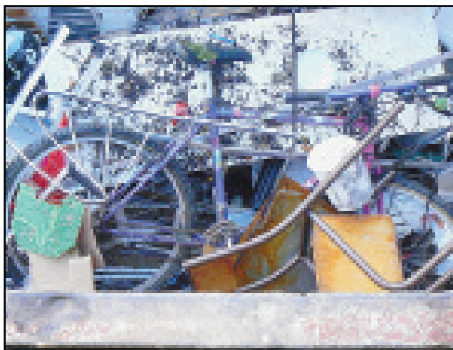
Un vélo, des vêtements... Quelques exemples d'objets qui terminent à la déchetterie de Saint-Malo et qui pourraient avoir une nouvelle vie.

Chaque mois, les encombrants sont aussi ramassés à